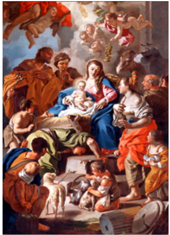
Epifania alla Chiesa della Nunziatella