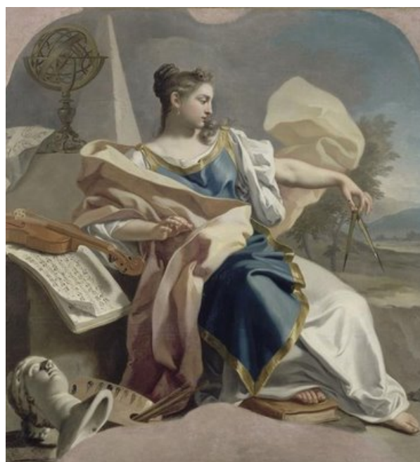
Allegoria delle arti al Museo del Louvre