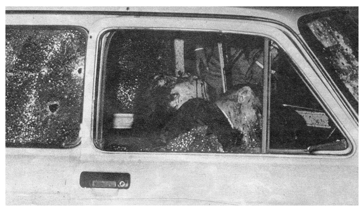
La scena dell'omicidio dei coniugi Dalla Chiesa il 3 settembre 1982