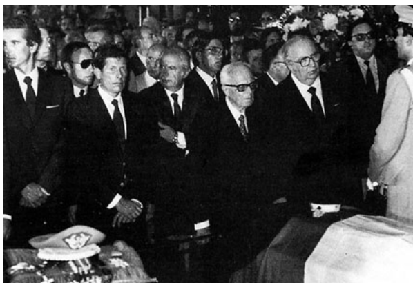
I funerali di Dalla Chiesa. Riconoscibili in prima fila: il presidente della Repubblica Sandro Pertini e Giovanni Spadolini a quel tempo presidente del Consiglio